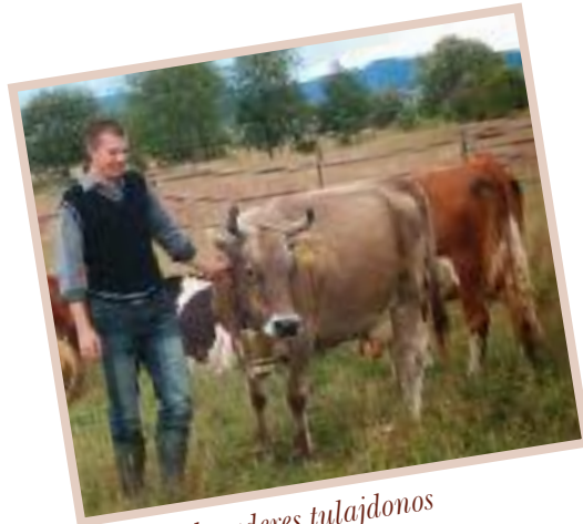
A boldog borzderes tulajdonos

A háztáji állattartás bátorítása és az egészséges ételkészítés helyi előállítás érdekében szeretnénk elindítani állatkihelyezési programunkat. Ez azt jelenti, hogy kárpáti borzderes szarvasmarha állományunkból néhány tehenet kiadunk ingyenesen az állattartásra vállalkozó családok, gazdák számára. Az állat a mi állományunkban marad, ellenőrizzük a tartási körülményeket, cserébe részesedést kérünk annak hasznából, mint a tejhaszon és a szaporulat. A nekünk leadott tejhaszon egy részét sajt és egyéb termékek formájában visszajuttatjuk a tartó család számára, így a tartás során néhány alapvető ételkészítéssel biztonságos ellátást kaphatnak a velünk együttműködők.