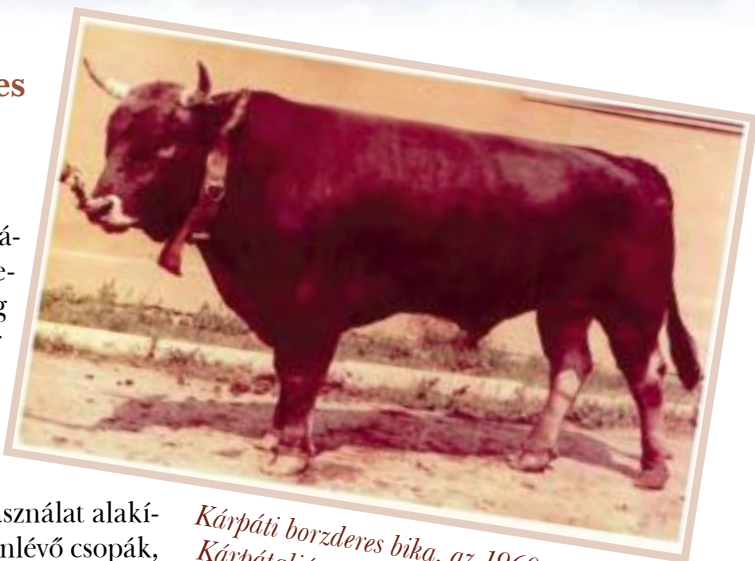
Kárpáti borzderes bika, az 1960-as években, Kárpátalján

Mint minden régi fajta, így ez is kettős hasznú (tej, hús), valamint kiegyensúlyozott egy harmadik haszonnal is, az igáztatással, mely haszonvétel a szegényember számára elengedhetetlen volt.