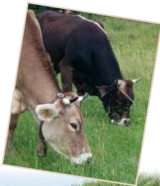
A Polyán gazdaságban 2011-ben született borjak a Malomréten

Hazánk domborzati és természeti viszonyaihoz jól igazodó fajta, nem véletlenül volt honos Észak-Kelet Magyarországon (Szatmár, Bereg és Zemplén) még a múlt század második felében is. A fajtát az intenzifikáció, a termelési eredmények versenyszerű feltornázása szorította ki az állattartásból. Ezzel párhuzamosan természetesen átalakult az állattartás szerkezete is, hiszen falvainkból eltűnt a háztáji és szinte egyeduralgódóvá vált az iparszerű, nagyüzemi állattartás.