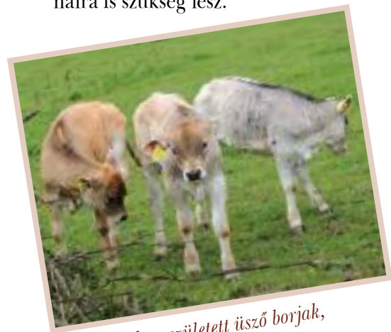
2013-ban született üsző borjak, 2 hónapos korukban

A kárpáti borzderes kutatási, majd tenyésztési programjában biztosítani fogjuk, hogy fagyasztott sperma is beszerezhető legyen, és így a termékenyítés a helyi inszeminátorral, a szokásos módon elvégezhető lesz. Jelenleg két tenyészbika vérvonalunk van, de a fajta fennmaradása érdekében több bikavonalra is szükség lesz.