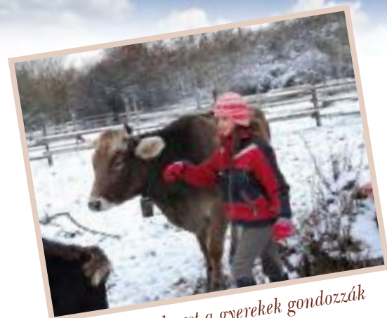
A szelíd borzderest a gyerekek gondozzák

kiszolgáltatottságunkat az élelmiszer ipartól. Ilyen szempontból a szarvasmarhának kulcs szerep jut, hiszen a tejtermékek fontossága vitathatatlan, még akkor is, ha magáról a tejről és annak élettani hatásairól megoszlanak a vélemények. Ezenkívül a háztáji, külterjes módon tartott állatok hús- és tejminősége, beltartalmi értéke kiváló, hiszen szinte kizárólag természetes takarmányt fogyasztanak. Így nem csak az önellátásban, hanem az egészségünk megtartásában is nagy szerepük van. Ismerjük a mondást: „ Amit eszünk, azzá leszünk ”.