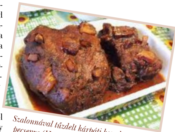
Szalonnával tűzdelt kárpáti borzderes pecsenye (Hanyi módra)

kiszolgáltatottságunkat az élelmiszer ipartól. Ilyen szempontból a szarvasmarhának kulcs szerep jut, hiszen a tejtermékek fontossága vitathatatlan, még akkor is, ha magáról a tejről és annak élettani hatásairól megoszlanak a vélemények. Ezenkívül a háztáji, külterjes módon tartott állatok hús- és tejminősége, beltartalmi értéke kiváló, hiszen szinte kizárólag természetes takarmányt fogyasztanak. Így nem csak az önellátásban, hanem az egészségünk megtartásában is nagy szerepük van. Ismerjük a mondást: „ Amit eszünk, azzá leszünk ”.