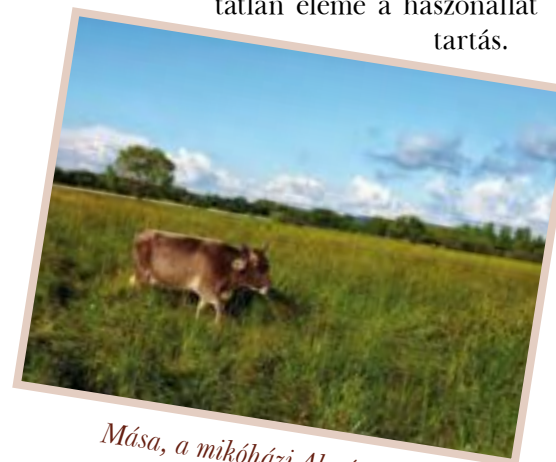
Mása, a mikóházi Almásréten

Egy bodrogi parasztember mondta, hogy „nincs mezőgazdaság állattartás nélkül”. És valóban, Ő még egy természetes rendben, körforgásban gondolkozott, ahol a talaj nem erőforrás, hanem egy élő rendszer, amivel az embernek gazdálkodnia kell a szó legnemesebb értelmében. Ennek a természetes körforgásnak az egyik kihagyhatatlan eleme a haszonállat tartás.