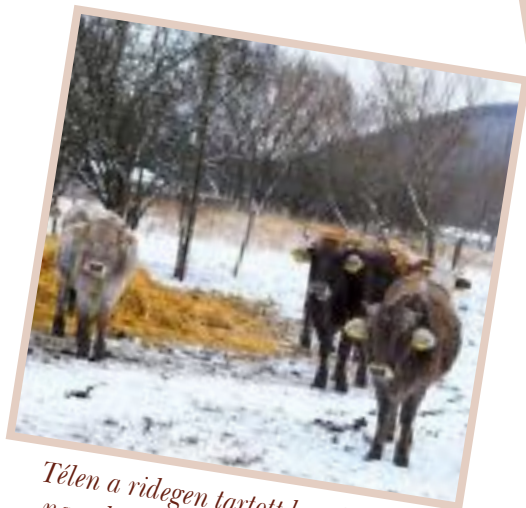
Télen a ridegen tartott borzderesek nagy bundát növesztenek

A háztájiban tartott szarvasmarha esetében kéziszerszámokkal képesek vagyunk ellátni az állatokat. A takarmány előállítás eszközei az egyszerű kerti szerszámok, illetve a széna előállítás eszközei.