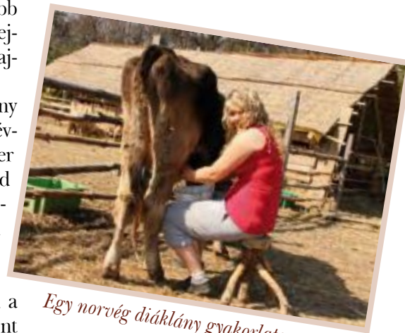
Egy norvég diáklány gyakorlaton

A magyar gyepek a szakirodalom szerint változatosabbak, mint a nyugat-európai legelők, hiszen általában 60 gypösszetevőből állnak, de nem ritka a 130 féle gypalkotó sem. Ez a változatosság megjelenik a tej és a sajt minőségében.