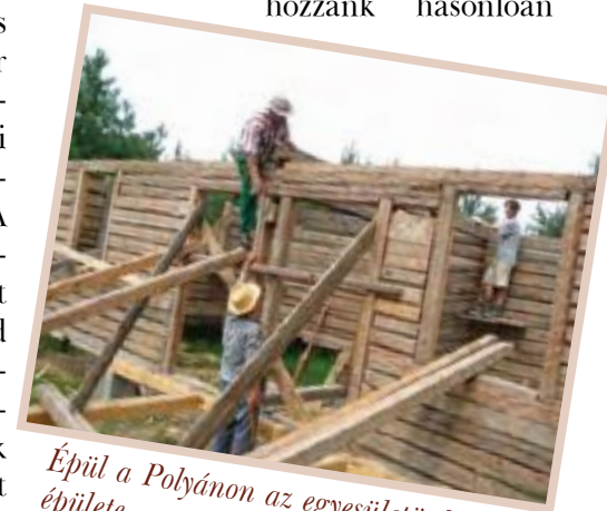
Épül a Polyánon az egyesületünk központi épülete

Azt gondoljuk, hogy az induló gazdaságok (ahol nincs meg az a tőke, amivel egyből ki lehet építeni az állattartás teljes infrastruktúráját) törvényszerűen küzdenek az első 4-5 évben ezekkel a problémákkal. Ezért azok, akik hozzánk hasonlóan