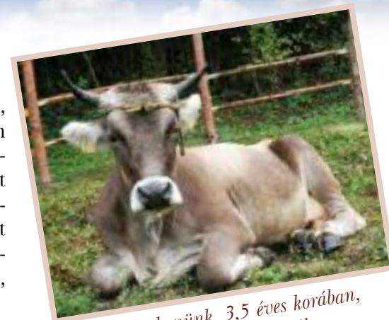
Kicsi nevű tehenünk, 3,5 éves korában, a Hegyközi HelyiTermék Fesztiválon

A kiadványt azzal a céllal készítettük, hogy választ adjunk azokra a gyakran felmerülő kérdésekre, amellyel az érdeklődők meg szoktak keresni minket az állattartással és gazdálkodással kapcsolatban. Nem tudományos értekezést készítettünk, hanem a saját tapasztalatainkat szeretnénk átadni őszintén, érthetően és gyakorlatiasan.