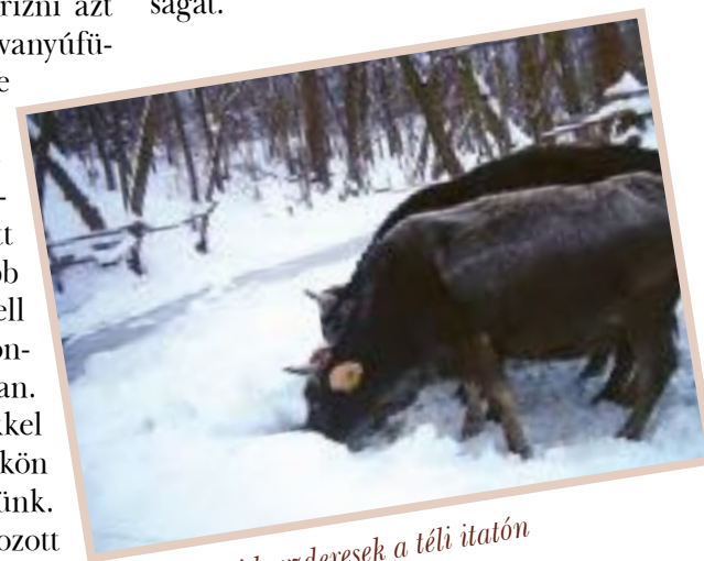
Kárpáti borzderesek a téli itatón

az általunk használt szántó területekre nem kapunk agrár támogatást. Ez a szántó gazdálkodásunkat igen költségessé teszi. Az már csak hab a tortán, hogy felénk, a Hegyközben a szántó területek igen gyenge minőségűek, ezért az átlagosnál több tápanyagutánpótlás szükséges, ami tovább rontja a szántóföldi takarmány előállítás gazdaságosságát.