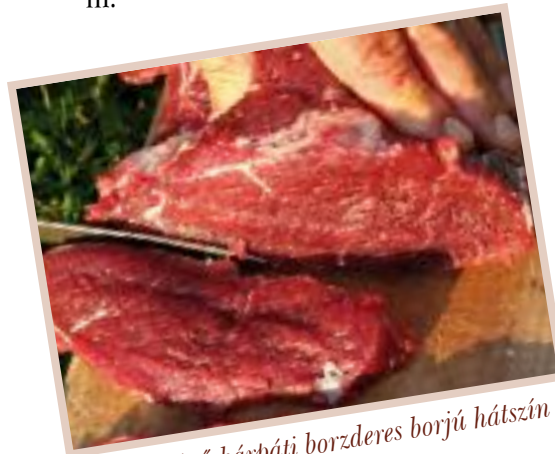
Jó minőségű kárpáti borzderes borjú hátszín

Amennyiben nincs szükségünk ennyi borjú húsrá, akkor - mivel Magyarországon a borjú hús kelendő termék - a bika borjakat élőállatként, vagy feldolgozott formában tudjuk értékesíteni.