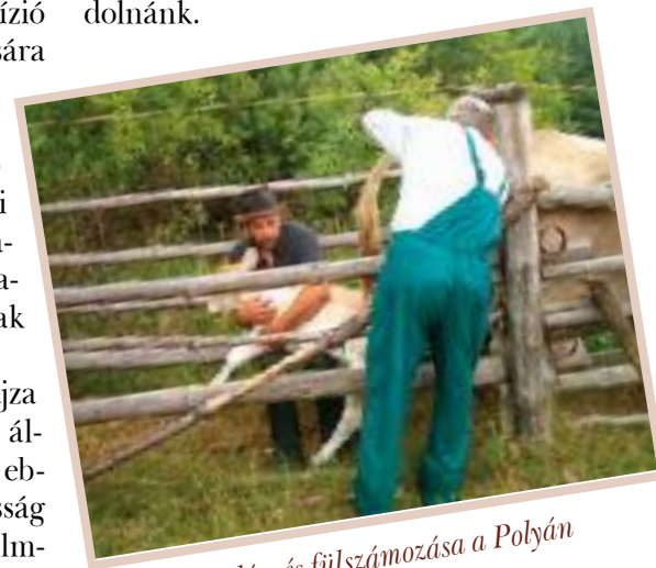
A borjak kezelése és fiúszámozása a Polyán gazdaságban

Egyre többen választják a falusi életet, törekszenek az önellátásra, azonban a kiköltözők többsége nem vág bele a nagyállat tartásba. Ennek fő oka, hogy az emberek félnek az állattartástól. Megszűnt a közvetlen kapcsolat az állatokkal és így nem érezzük magunkban a tudást, rátermettséget, félünk a felelőstől. Ezek az állatok növényevő menekülő állatok, ők sokkal kiszolgáltatottabbak az embernek, mint gondolnánk.