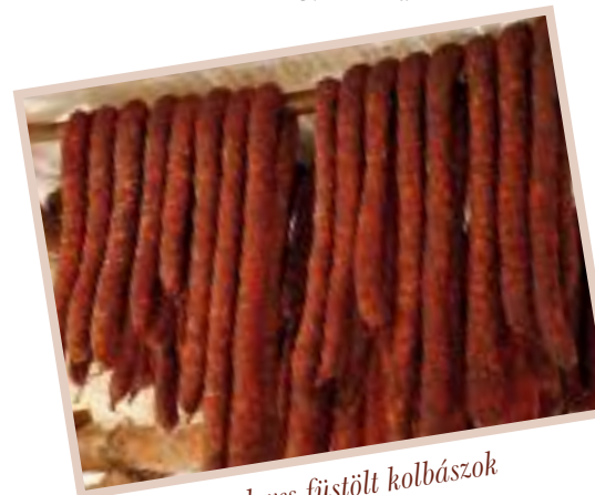
Kárpáti borzderes füstölt kolbászok a Mikóházi Böllérfesztiválon

A gazdaságunkban bika borjakat vágunk, melyek 8 hónapos korukra 230-250 kg-os súlyt érnek el. A húst közvetlenül, vagy feldolgozva értékesítjük. Feldolgozás során kolbászt és szalámit készítünk belőle, melyhez mangalica szalonnát keverünk, hogy a marhahús száraz és gyorsan keményedő állagát javítsuk. Háromféle ízesítésben készült füstölt áruiink nagyon népszerűek.