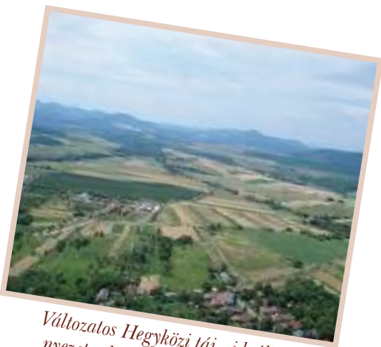
Változatos Hegyközi táj - ideális környezet a kárpáti borzderes számára

területekkel is. Egy magasabban fekvő, kevésbé csapadékos vidéken található legelő például nagyon megsínyli a szárazságot, míg egy csapadékosabb évben a mélyen fekvő, vagy vízjárta területeken lehetetlenül el a legeltetés. Ha ilyen szélsőségeknek kitett területekkel rendelkezünk, akkor egy ideális év tapasztalataira ne építsünk gazdálkodást! Tervezzük úgy, hogy az elképzelhető szélsőséges viszonyok között is tudjunk legeltetni, valamint téli takarmányt gyűjteni!