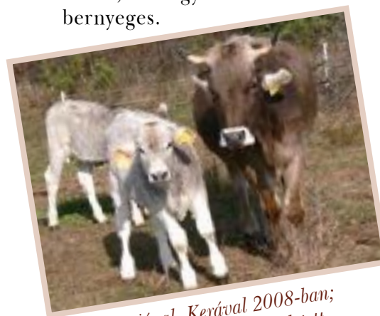
Mami a borjával, Kerával 2008-ban; Ő az első borjú, aki nálunk született