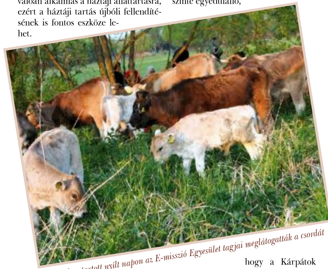
A 2010-ben tartott nyílt napon az E-misszió Egyesület tagjai meglátogatták a csordát

Megfelelő tartás esetén - erről később írunk - szelíd, átengedő természetű. Erre lehet példa, hogy Európában szinte egyedülálló,