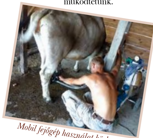
Mobil fejőgép használat közben

A mi gazdaságunk egy 80 lóerős traktort használ. A traktorhoz tartozó eszközök a bálafogó, trágyavilla, dobkasza és egy rendszdró, valamint egy régi, felújításra szoruló 5 tonnás pótkocsi. A téli etetés során 4 körbála etetőt használunk. A fejést egy mobil fejőgéppel végezzük, amit áram hűjűn agregátorral működtetünk.