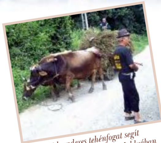
A kárpáti borzderes tehénfogat segít a kisgazdaság munkájában, Moldvában

Napelemes rendszerünkkel a villanypásztorhoz szükséges energiát állítjuk elő. Nem rendelkezünk bálázógéppel, aminek a hiányát már több ízben megszenvedtük, amikor nem sikerült időben bér munkában bebáláztatni a szénánkat.