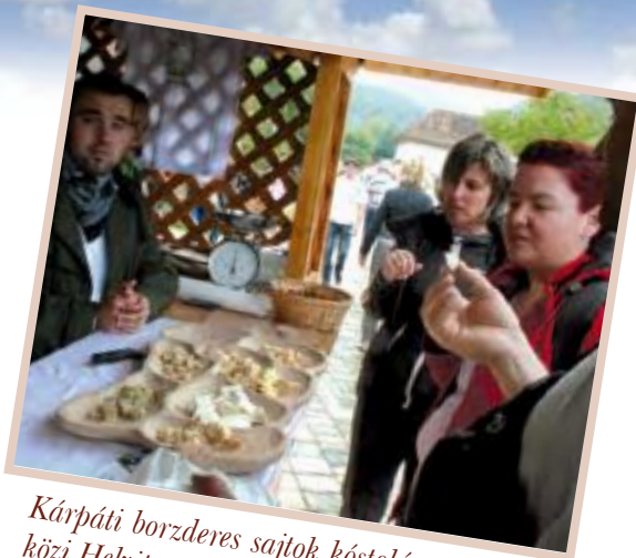
Kárpáti borzderes sajtok kóstolása a Hegyközi Helyi termék Fesztiválon

Egy kiló friss sajtot tapasztalataink szerint 7 liter tejből tudunk előállítani, de az őszi tejből 4,5 liter is elegendő volt. A sajtjainkat megkóstoló hazai tapasztalt sajtkészítők egyöntetűen kedvezően nyilatkoztak az általunk készített sajtok minőségéről. Tejünk az érlelt sajtok készítésére kiválóan alkalmas, ami a sajtok piacra juttatásakor lényeges szempont, hiszen az érlelésnek köszönhetően csökken a termelő piaci kiszolgáltatottsága, maga döntheti el, hogy mikor kínálja eladásra az érlelt sajtot.